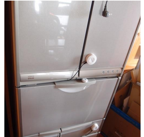
停電状態で観察中の様子