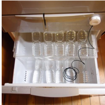
冷凍庫内の様子(開始前)